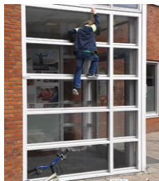
Ontwikkelen van risicocompetenties